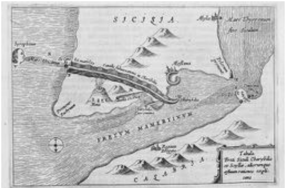
Abb. 1 Die Vermessung maritimer Mythen: Scylla und Charybdis. Kupferstichillustration zu Athanasius Kircher: Mundus subterraneus, Amsterdam 1665.

men alle Ehre machte: die ihm eine eigene Unsterblichkeit ( athanasia ) verlieh (bis aufklärerisches Denken ihn als Scharlatan und wahllosen Eklektizisten für Jahrhunderte aus dem wissenschaftsgeschichtlichen Gedächtnis verbannte).