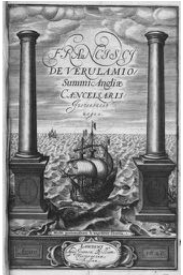
Abb. 1 Weltneugierde als Pflicht: Frontispiz von Francis Bacons «Instauratio magna» (London: Bilius 1620).

freilich nicht orientierungslos wie Dantes Odysseus bleiben, sondern von einem methodischen «Kompass» angeleitet werden. Ganz nach Art der Seeleute mit ihrer praktischen Magnetismusforschung setzte Bacon dabei auf Reflexivität: auf die rekursive Struktur des Wissens und dessen laufende Vermehrung durch Selbstbeobachtung. Die «Wellen des Zufalls», jene Kontingenzen und Störungen, welche die Naturerforschung gefährden, waren für ihn kein Hinderungsgrund, sondern Elemente eines kontinuierlichen und systematischen Forschungsprozesses. Im Rahmen seiner nautischen Metaphorik verwarf er deshalb Lukrez' kontemplatives Modell des suave mari magno : Vom sicheren Ufer aus den Untergang anderer zu betrachten oder ihn als erhabenes Schauspiel zu genießen, sei ein ungleich geringeres Vergnügen, als vom Boden gesicherten Wissens aus überlieferte «errors» und «perturbations» zur Vermehrung dieses Wissens zu nutzen. 16 Deshalb hält sich Bacons Nova Atlantis mit dem Schiffbruch, der den Erzähler ja allererst auf die Insel verschlagen hat, nicht lange auf; statt Szenen des Scheiterns auszumalen, dreht sich die Utopie nicht zuletzt um wissenschaftliche Erfindungen, die Havari-