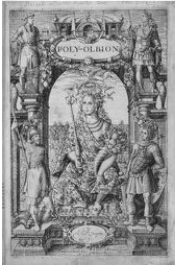
Abb. 4 Thronende Allegorie. Titelblatt zu Michael Draytons «Poly-Olbion», 1612.