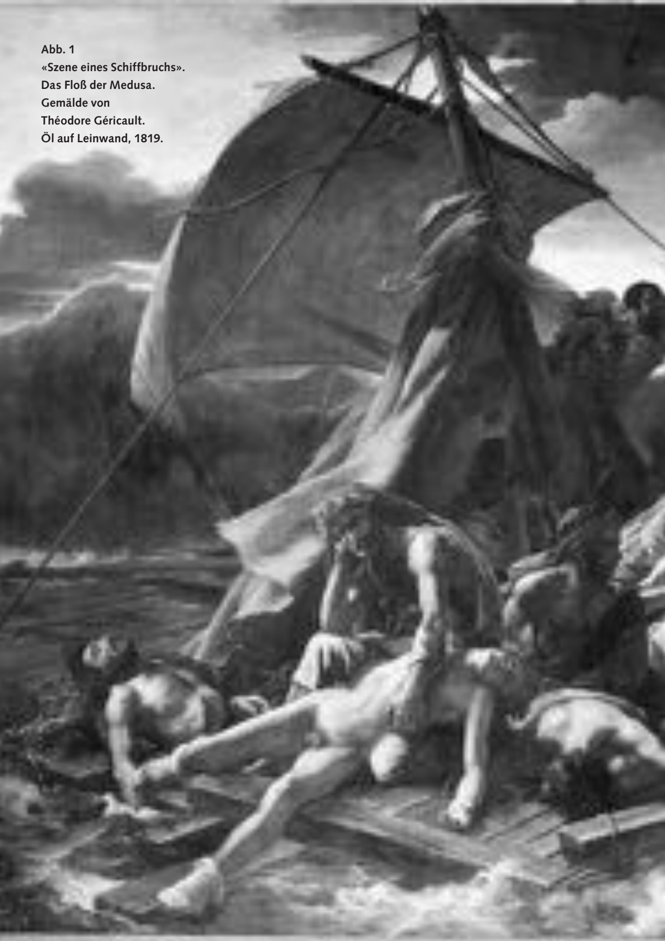
Abb. 1 «Szene eines Schiffbruchs». Das Floß der Medusa. Gemälde von Théodore Géricault. Öl auf Leinwand, 1819.