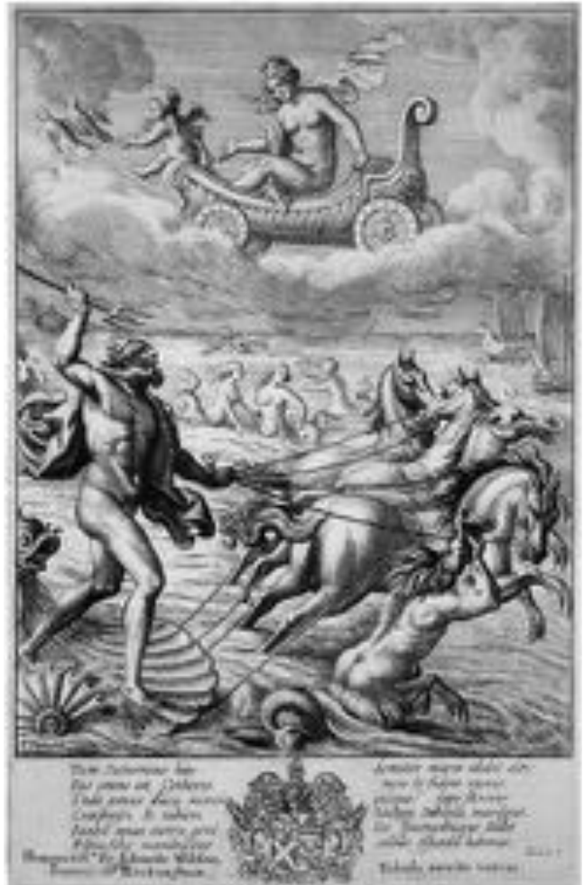
Abb. 7 Verkehrsmittel der Götter. Wenzel Hollars «Venus und Neptun», nach 1697.