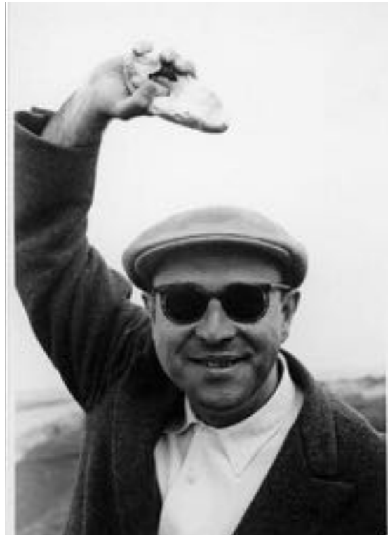
Abb. 1 Hans Blumenberg mit «Hühnergott», frühe 50er-Jahre.