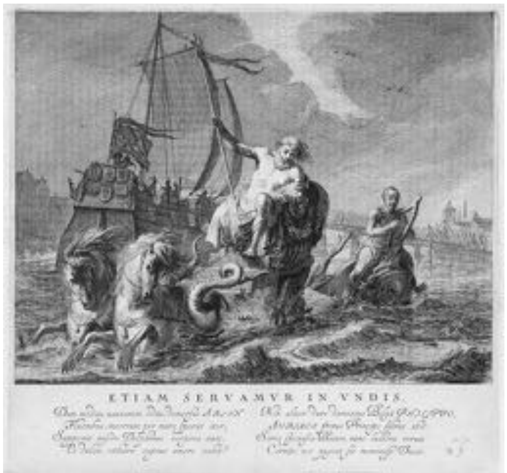
Abb. 5 Neptun und Arion als Wellenreiter. Pieter Nolpes «Etiam servamur in undis», 1642.

fand. So dichtete er über den zurückgekehrten König: «You are our Neptune, every Port, and Bay / Your Chambers, the whole Sea is your High-way / Through sev’ral Nations Boast their Strength on Land, / Yet you Alone the watr’ry World command». 34 In der Druckausgabe des Krönungszeremoniells The Entertainment of His Most Excellent Majestie Charles II (1662) konnte man sehen, dass den Neptungesängen auch eine Festikonographie entsprach. Für das Krönungszeremoniell hatte Ogilby Triumphbögen entwerfen lassen, die der maritimen Macht Englands Rechnung trugen. Der Duke of York wurde auf einer von Seepferden gezogenen Muschel gezeigt und der König als Meerresgott beschworen, der Sturm und Gewitter beschwichtigt. 35