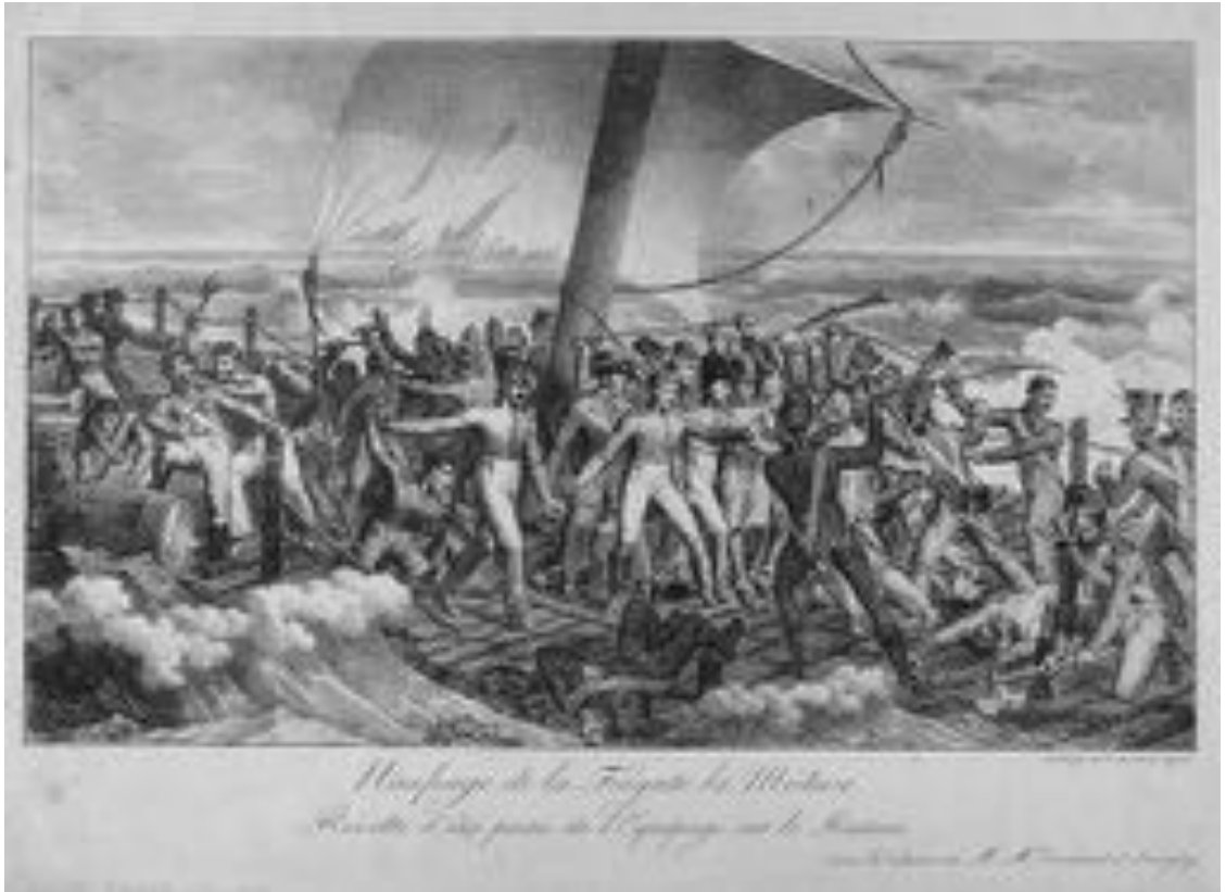
Abb. 1 Klassenkampf auf schwankendem Boden. Charles Philibert Lasteyrie du Saillant nach Hippolyte Lecomte: Meuterei auf dem Floß der Medusa, Lithographie 1818.

boote kam es zur Meuterei von Teilen der Mannschaft, die sich auf dem Floß, auf dem kein Platz zum Sitzen war und das teilweise fast einen Meter unter Wasser stand, blutig fortsetzte (Abb. 1). Die antagonistischen Gruppen auf dem Schiff aktivierten ein zerstörerisches Konfliktpotenzial, das als politische und soziale Spannung unterschwellig bereits vorgegeben war. Die Autoren zeigen auf, wer in die Rettungsboote und wer auf das Floß verteilt wurde – eine soziale Hierarchisierung und Manifestation der Ungerechtigkeit, da überwiegend Soldaten aus Kolonialregimentern und Matrosen auf das Floß beordert werden; aber auch Ausweis einer unerklärlichen Unfähigkeit, da die Evakuierung aller Passagiere von dem noch nicht untergegangenen Schiff mit den Beiboote an die nur wenige Kilometer entfernte Küste noch möglich gewesen wäre.