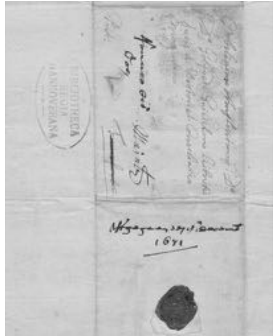
Abb. 1 und 2 Unter der Rose der Verschwiegenheit: Baruch de Spinozas Siegel in Umzeichnung und auf einem Brief an Leibniz vom 9. November 1671.

«Ausdrucksweise»; er besteht nicht so sehr aus einer Reihe von Ideen – was soll schließlich der Inhalt des Unglaubens sein? Einfach gar nichts? Kann man wirklich an eine Welt ohne Freiheit «glauben»? Welche Konsequenzen könnte es haben, an eine solche Welt zu glauben? Nein, er ist vielmehr ein Stil, ein Stil der Selbstverschleierung, der Irreführung, des nicht Sagens, was man meint.