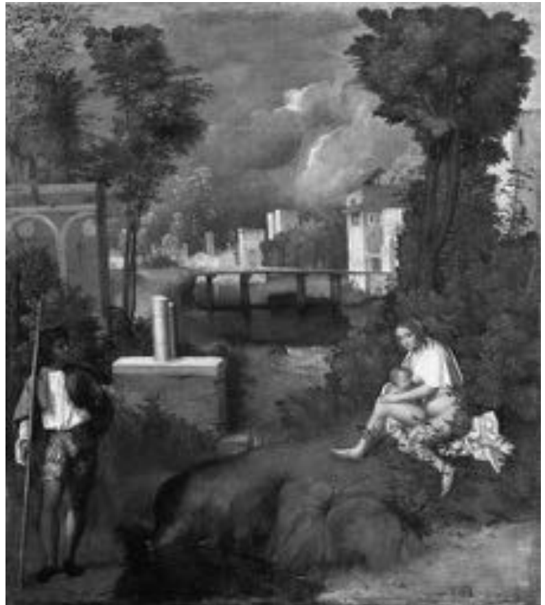
Abb. 1 Giorgione, «La Tempesta», Galleria dell'Accademia, Venedig.

→ Vgl. Belting: Exil in Arcadien, S. 50.