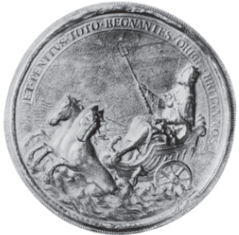
Abb. 2 Der König als Neptun. Siegel Charles II. für Barbados und die Karibik, 1662.

Siegel sollte dann auch Auslöser für Warburgs Frage nach dem Auftauchen und der Abkunft maritimer Ikonographie sein. Auch er verschrieb sich dem Thema der Herrschaft über die Elemente, wenn er auch aus der Ikonographie gelernt hatte, dass in der Geschichte der Götter- und Herrschergespanne erst die Luft kam, dann das Wasser. Schon der Muschelwagen Neptuns war ein bildgeschichtlicher «Leihwagen». Es war Sol oder Helios, dessen Sonnenwagen zum Urbild aller göttlichen Verkehrsmittel wurde. In den Notizen zur «Funktion der Briefmarkenbilder» notierte Warburg: «Das Verkehrsmittel als techn. Bezwingler des Elements / drängt zur Darstellung. / D.Souverän als mythischer Herrscher des Elements / fordert höchsten Kult. / Neptun=Herrscher.. Wasser / dramatisch. Relief. / Alexander – Karl d. Kühne / Luft und Wasser». 23