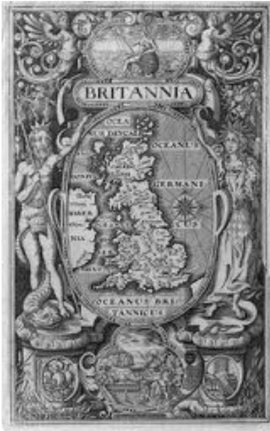
Abb. 3 Britannia in der Gisch. Titelblatt zu William Camdens «Britannia», 1607.

Formen: Man zeigte sich zu Pferde, als Heiliger Georg oder allgemein angelehnt an die christliche Ikonographie.