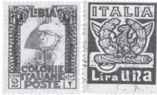
Abb. 1 Metapher und Bedrohung. Markenbilder aus Warburgs Vortrag zur «Funktion des Briefmarkenbildes im Geistesverkehr der Welt», 1927.